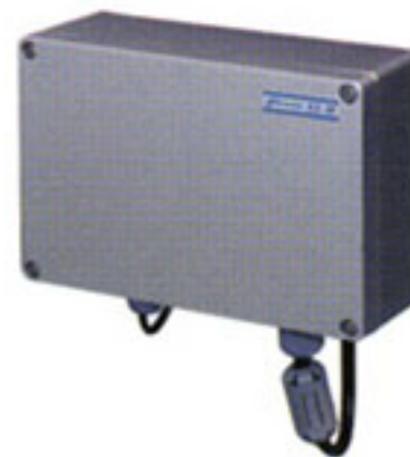
AD-32(AC100V) AD-33(AC110~120V) AD-34(AC220~240V)

The AC adapter used to convert AC100-240V to DC24V and to supply power to the CM-800 \alpha