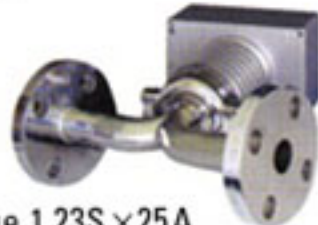
JIS Flange 1.23S x 25A