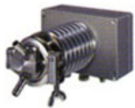
Hose connector 12mm Ø