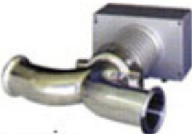
IDF/ISO Clampunion (ferrule) 2S