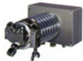
압축피팅 12mm Ø