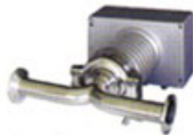
IDF/ISO Clampunion (ferrule) 1S